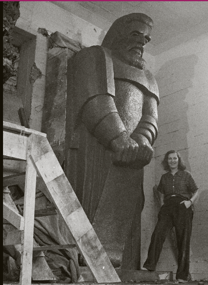
La escultora Lily Garafulic junto a uno de "Los Profetas".