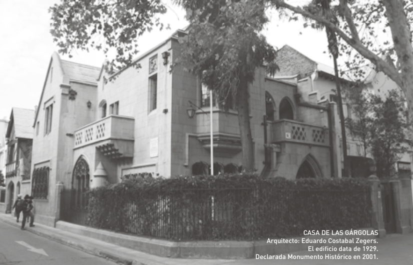
CASA DE LAS GÁRGOLAS Arquitecto: Eduardo Costabal Zegers. El edificio data de 1929. Declarada Monumento Histórico en 2001.