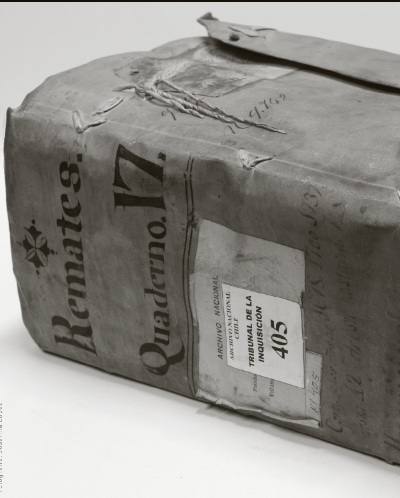
Parte de los Archivos Jesuitas. Tribunal de la Inquisición.

De este modo, estas piezas catalogadas que ya son Memoria del Mundo, podrán ser vistas en línea, sin restricciones, por toda la ciudadanía, incluyendo a historiadores, docentes e investigadores de Chile y el mundo.