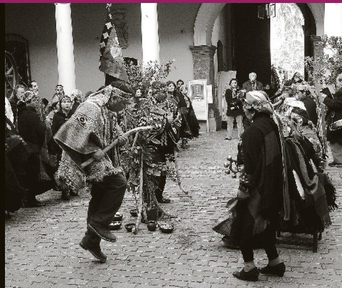
Celebración Wiñol Tripantu: Año Nuevo Mapuche. Patio del Museo Histórico Nacional, 2013.

El Museo Histórico Nacional y el Consejo Red Salud Wariache, le invitan a conmemorar el Wiñol Tripantu 2014. Como ya es tradición, el museo celebra junto a toda la comunidad el “Wiñol Tripantu: año nuevo mapuche”, festividad milenaria que celebra el pueblo originario para marcar el cambio de ciclo anual relacionado con el solsticio de invierno. Esta actividad se enmarca en el espíritu de integración de nuestras culturas autóctonas para darles el merecido espacio de difusión y visibilidad que merecen. Habrá diversas actividades como: charlas, stands (muestra medicinal y cultural), presentaciones artísticas-culturales y rogativas. Martes 17 al viernes 20 de junio.