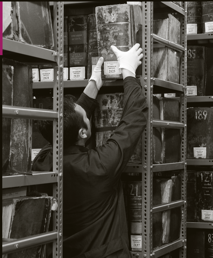
En las bóvedas del Archivo Nacional

El sitio funcionará mostrando la imágen de la institución junto a algún documento destacado y su reseña histórica.