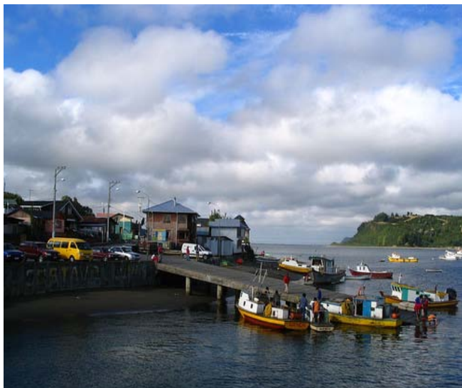
Vista de Quemchi.